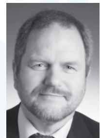
BSF Schandorff Vang