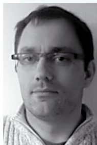
SKF: Johnhard Klettheyggj