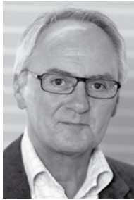
Varaforseti: Petur Ove Petersen